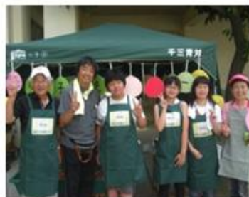
地域行事に模擬店参加